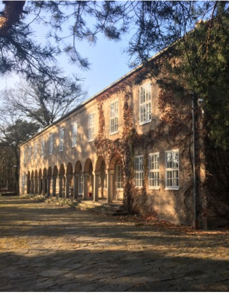
Das Haus Lenné in Gatow

Auf dieser Grundlage ging es dann zu einer Exkursion ins Haus Lenné, einer Entwöhnungseinrichtung für Menschen mit einer Abhängigkeitserkrankung am Stadtrand von Berlin. Dort hatte die Klasse im Rahmen eines Interviews die Möglichkeit, einen praxisbezogenen Einblick in die Suchthematik zu erlangen und vorbereitete Fragen an mehrere Patienten zu stellen. Fast 90 Minuten lang schilderten die Betroffenen sehr eindringlich von ihrem Drogenmissbrauch und welche Folgen dieser für sie selbst und ihr unmittelbares Umfeld hatte. Dadurch wurde auch noch einmal sehr deutlich, wie schlimm eine Abhängigkeitserkrankung ist und wie schwierig es ist, diese zu überwinden.