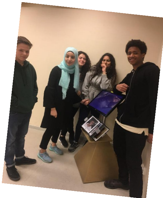
Abb.2-Abb.5 Stationsarbeit bei Karuna e.V.

Am Donnerstag waren wir auf einem Wandertag zu Karuna prevents e.V. in der Mauritiuskirchstr. 3. Dort arbeiteten wir nach einer kurzen Einführung durch eine Mitarbeiterin des Vereins an verschiedenen Stationen zum Thema Computer- und Spielsucht.